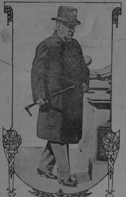
Ultimo retrato de J. P. Morgan