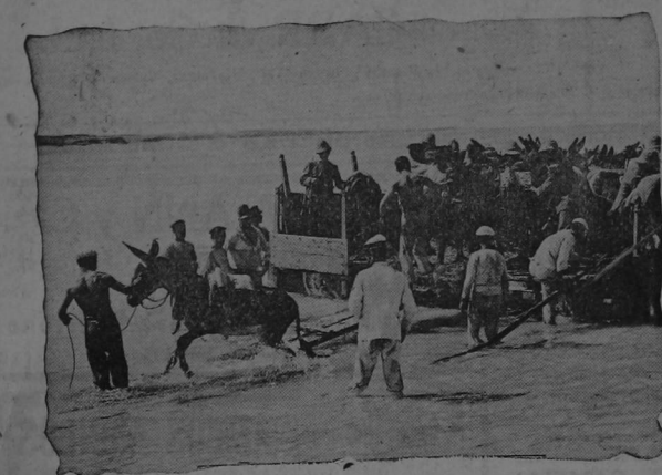
Desembarcando las mulas que servirán al ejército italiano para conducir armas y bajeos en el avance hacia el desierto. Hasta ahora se han desembarcado 3 800 mulas que la Intendencia italiana preparadas.